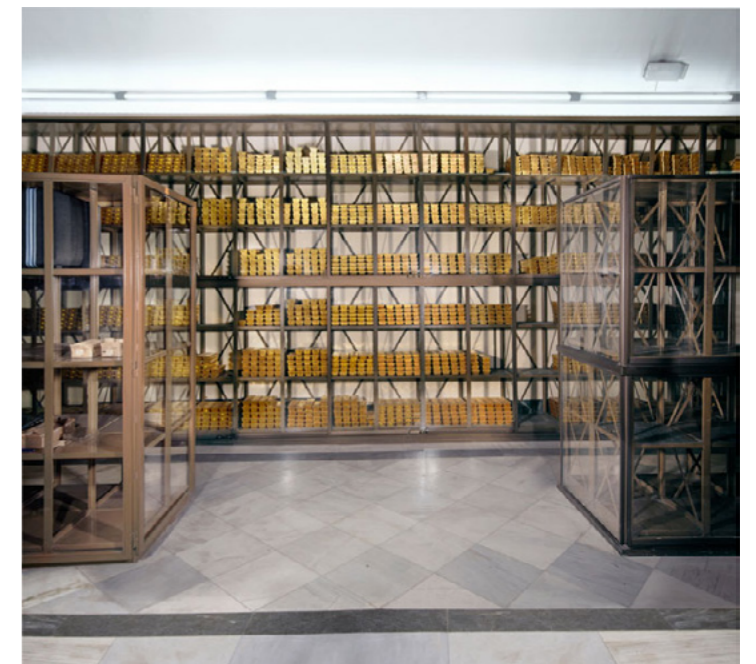
Cristina Lucas, The Treasure Vault